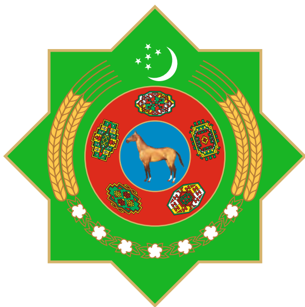
TÜRKMENISTANYŇ DÖWLET TUGRASY